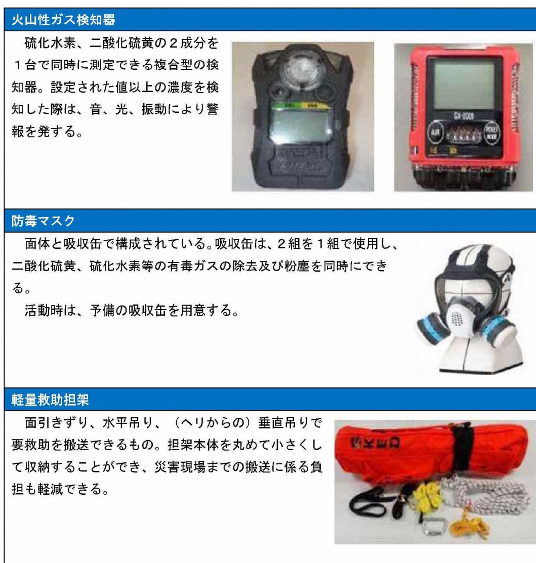
図 10-1 救助活動時に有用な資機材 (1/2)